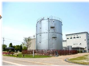
黒部浄化センター アクアパーク