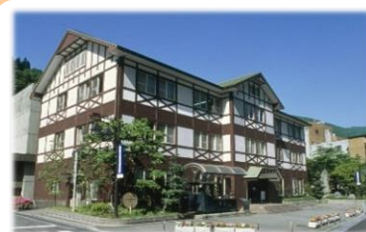
黒部川電気記念館 ・黒鉄宇奈月駅2階

黒部川の電源開発・宇奈月温泉・トロッコ電車の歴史を映像等で学ぶ (13:35~14:25)